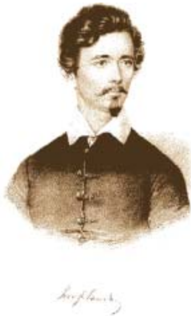
Barabás Miklós metszete