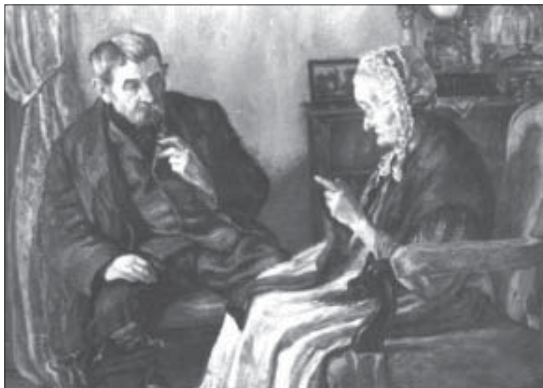
Bottlik Tibor: Öregek, olajfestmény, kézirat-másolat

A levelezésünk folytatódott, a róla írott cikkek sorozata is. Közben izgatottan készültünk a kiállításra, melyre röviddel a kilencvenedik születésnap előtt került sor. Együtt örvendtünk a bemutatkozásnak, az újjászületésnek, amely a Mestert több mint ötvenévi magány után, ismét visszahozta művészvilágba, érezhette azt a sajátos hangulatot, amelyet a századelőn Párizsban felejtett... Unnepelték a Maestrót,