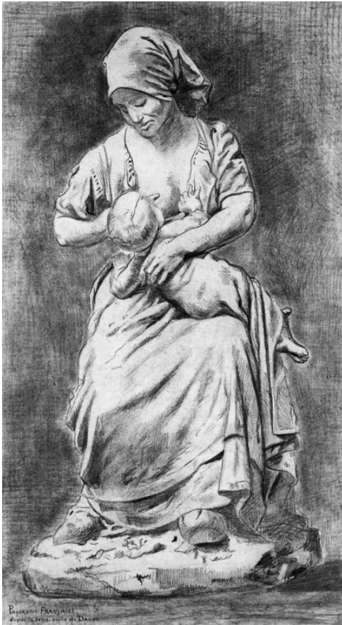
Vincent van Gogh (1853–1890) rajza