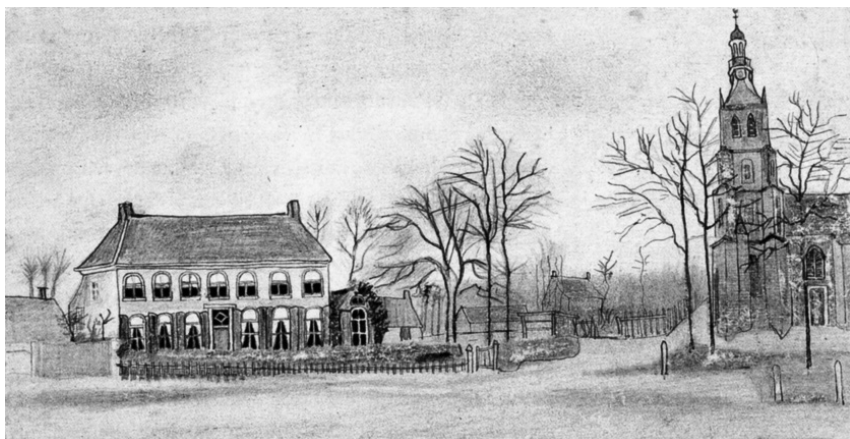
Vincent van Gogh (1853–1890) rajza