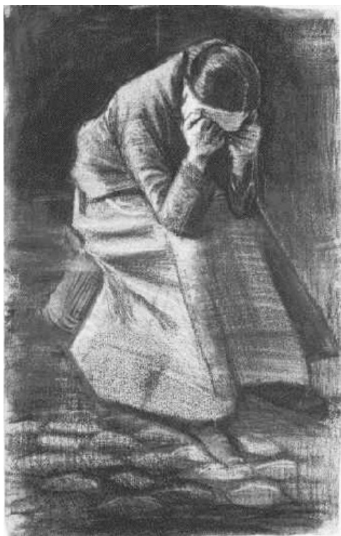
Vincent van Gogh (1853–1890) rajza

Nem tudom, felelem, azt hiszem, az lesz a legjobb, ha lemegek az országútra, és megpróbálok megállítani egy autót. Aztán majd rám támaszkodhatsz és lesántikálhatsz. Itt akarsz hagyni?, kérdezi elszontyolodva. Nem akarlak, de muszáj lesz. Hacsak nem akarsz odáig négykézláb jönni!, tréfálkozom, hogy felvidítsem. A fejét rázza: nem, azt azért nem. Elindulok lefelé, egy idő után már hallom az országúton elhaladó autók moráját. Iménti rettenetes rosszkedvem már szűnőben, hirtelen átjár a megkönnyebbülés. Most pár hétig nemigen tud majd kijárni a lakásból, gondolom, azért ez is valami. Nem sok, de valami.