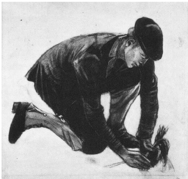
Vincent van Gogh (1853–1890) rajza